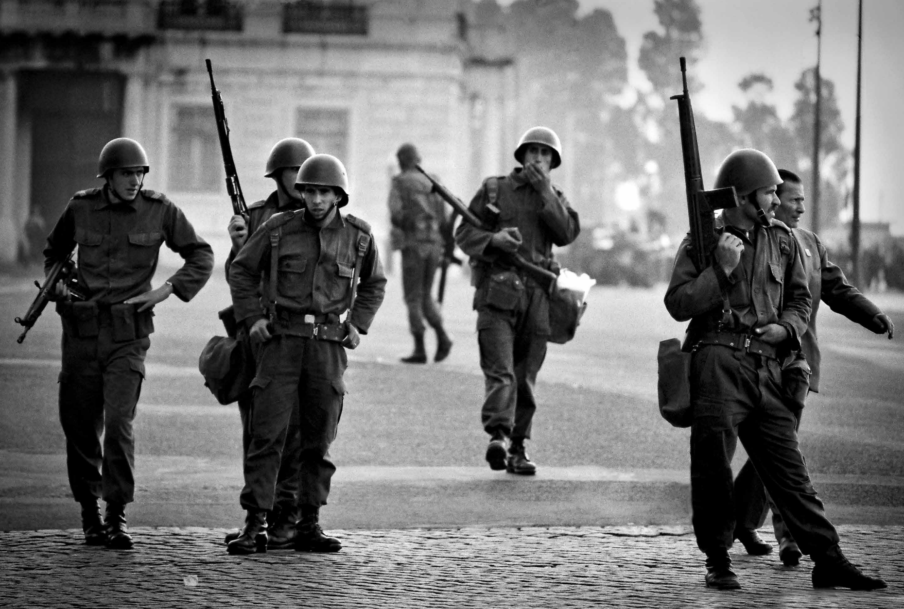
Av. Ribeira das Naus, 7h00